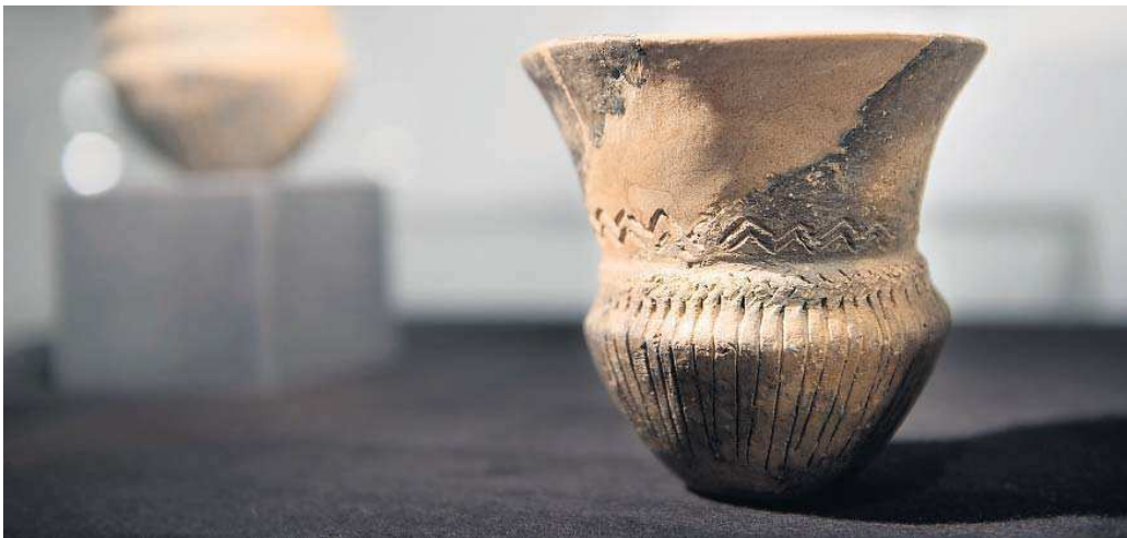
Trechterbekers uit Erica uit de periode van circa 3400 tot 2850 voor Christus.