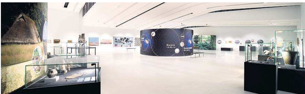
Een tijdlijn plaats de bezienswaardigheden bij expositie Hier kom ik weg in context.